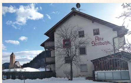
Die einstige Bergstation der „Alten Seilbahn“ in St. Kathrein bei Hafling am Tschögglsberg.

Die bei Einheimischen und Touristen gleichermaßen beliebte Seilbahn im Südtiroler Burggrafenamt war lange Zeit das einzige technische Verkehrsmittel auf das Hochplateau des Tschögglsbergs. Erst der Bau einer weiteren Bahn von Burgstall nach Vöran (Eröffnung 1948) schmälerte die Attraktivität der Haflinger Bahn, zur letztlichen Schließung der Linie führte dann in den frühen 1980er Jahren die Errichtung einer Fahrstraße auf den Bergrücken der Sarntaler Alpen.