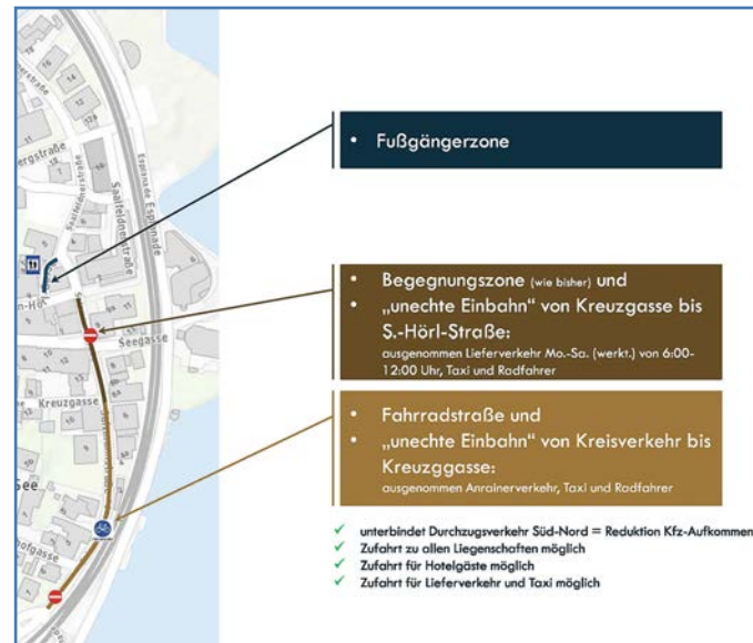
Grafik: © DI David Knapp, MA – Ingenieurbüro für Verkehrswesen und Verkehrswirtschaft e.U.

Da uns diese Thematik auch in den nächsten Jahren beschäftigen wird, gibt es im Herbst dieses Jahres eine Evaluierung der verordneten Verkehrsbeschränkungen, um über zusätzliche Möglichkeiten zu diskutieren, wie das Verkehrsaufkommen in der Unterstadt geregelt werden kann.